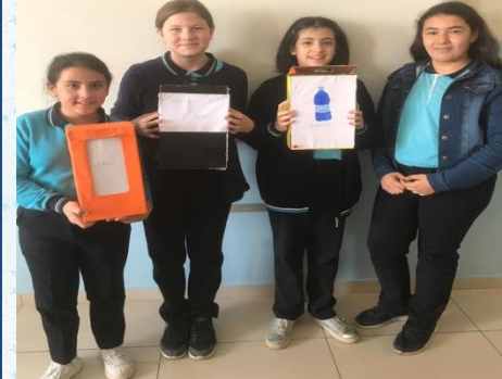
6. Sınıf Save The Planet ünitesinde 6/D ve 6/H öğrencileri farkındalık oluşturmak için pankart hazırlayıp, geri dönüştürülmüş materyal yaptılar.