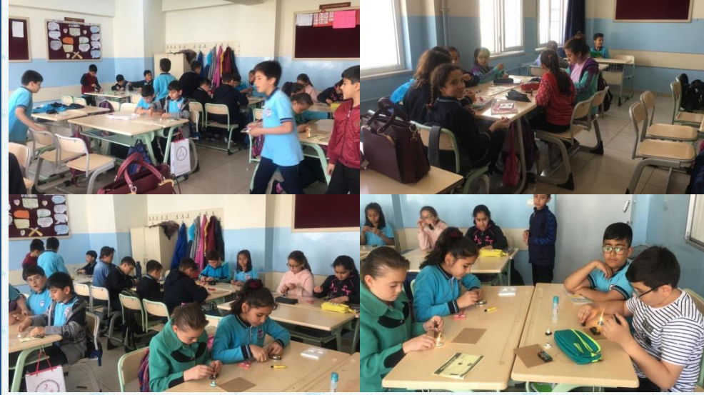
Öğrenciler basit elektrik devresi ünitesini kümeler oluşturarak grup çalışmasıyla yaptılar.