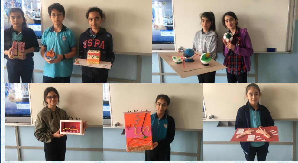
Fen Bilimleri dersimizde 6. Sınıflarda duyu organlarımız konusu öğrencilerimizin hazırladığı 3 boyutlu maketlerle işlendi.