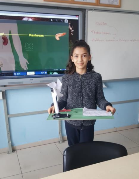
Fen Bilgisi dersinde öğrencilerimizin hazırlamış olduğu Yenilenebilir Enerji Santralleri maket çalışmaları.