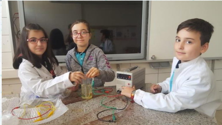
Tübitak 4006 kapsamında gazların kütlesi var mıdır? Adlı proje çalışmalarımız tüm hızıyla devam etmektedir.