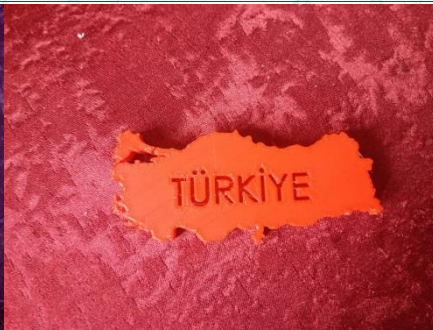
Teknoloji ve Tasarım dersinde öğrencilerimizin 3D yazı ile hazırlamış oldukları ilk çalışmaları.