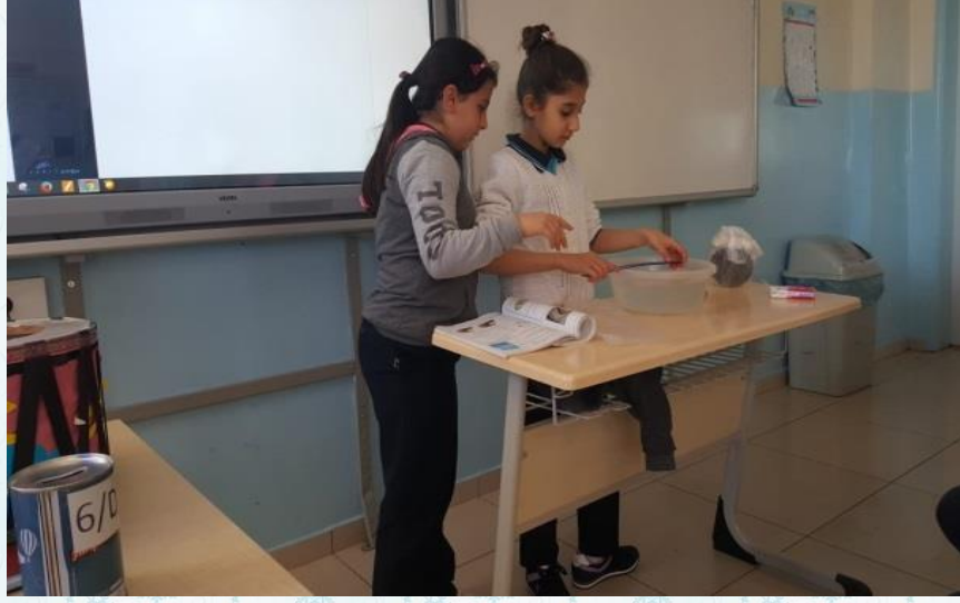
Fenbilgisi Dersi kapsamında ses deneyleri