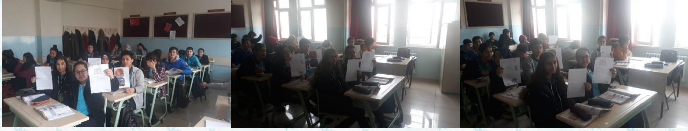
8/A sınıfı İngilizce dersinde Türkiye'nin turistik yerleri "tourism" ünitesiyle tanıtıldı.