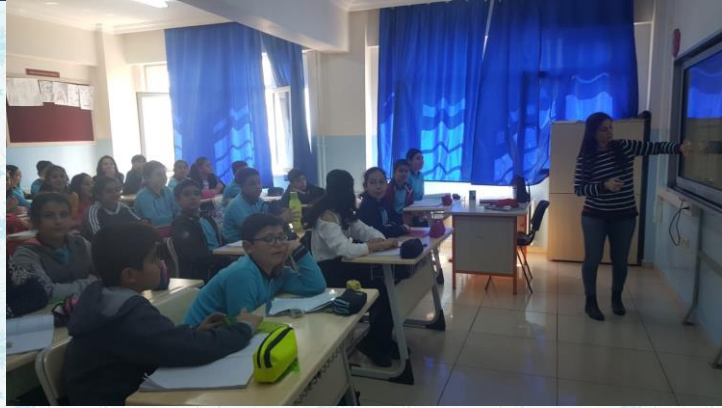
Kanguru matematik sınavı öncesi matematik hocalarım bilgilendirme yaptı.