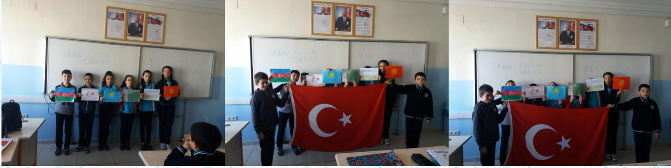
6/E sınıfı ile birlikte "Ana Dili" adlı metin işlendi. Türk devletleri, dilleri, bayrakları ve bayrakların taşıdığı anlam konuşuldu.