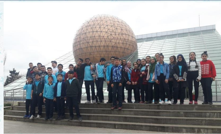
Okulumuz öğrencileri ile gezegen evini ziyaret ettik