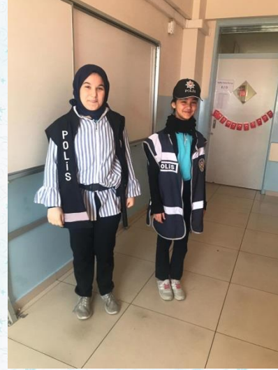
6. Sınıflar İngilizce dersinde meslekler konusu canlandırma yapılarak pekiştirildi.