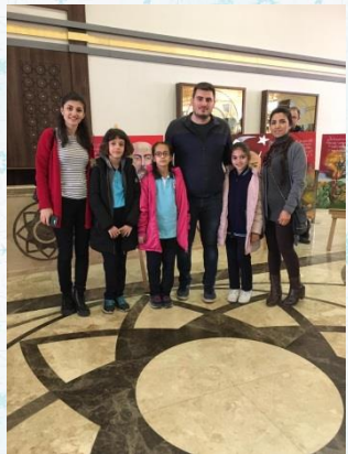
İstiklala Marşının Kabulü etkinliklerimizden bir kare