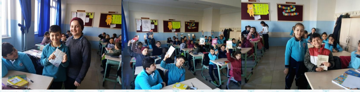
5/A sınıfında gönüllü öğrencilerle ile hediye çekilişi yapıldı. Arkadaşımın kütüphanesine birer kitap hediye ettiler.