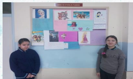
5/I sınıfında İngilizce dersinde cartoon characters ( çizgi film karakterleri) pano etkinliği ile tanıtıldı.