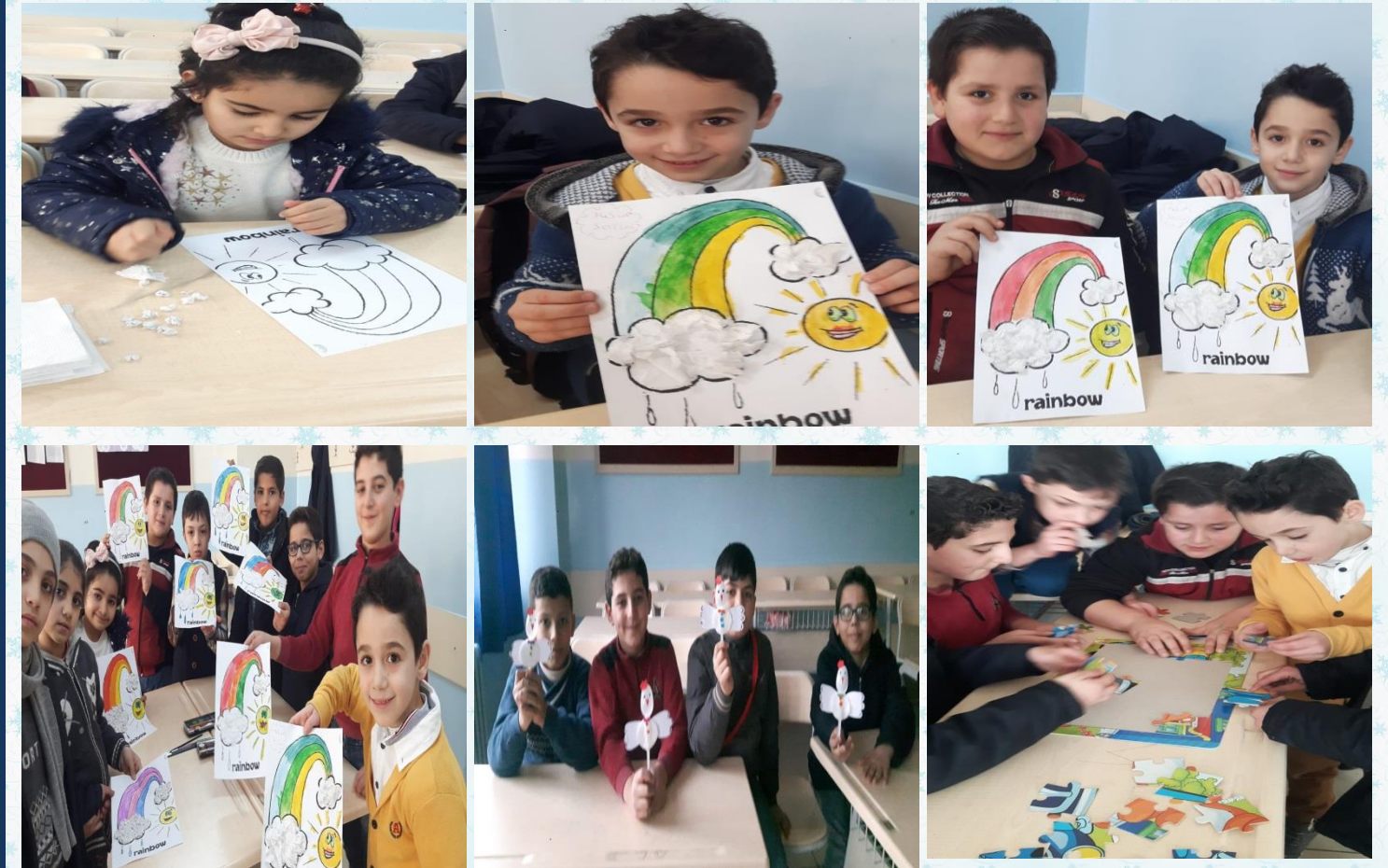
4.sınıf öğrencilerimiz grup etkinliği yaparak kaynaşiyor ve Türkçelerini geliştiriyorlar.