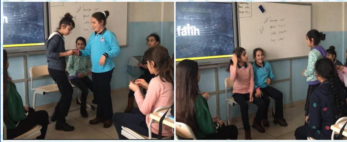
İngilizce dersinde öğrenciler meyveleri "Fruit Salad" oyunu ile pekiştirdiler.