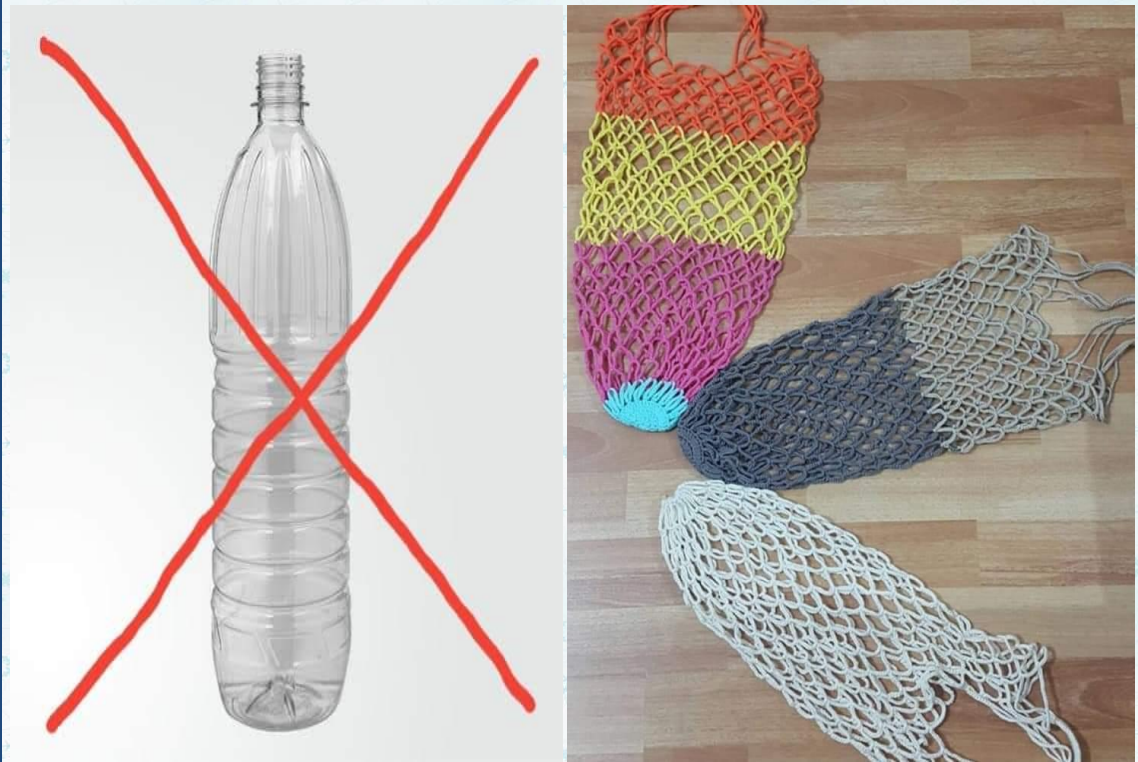
Okulumuza 10 adet pet şişe getiren herkese, öğrencilerimizden bez alışveriş çantası (file) hediye kampanyamız başlamıştır.