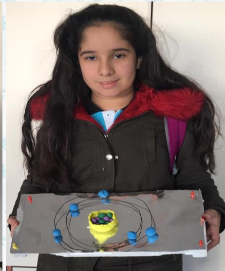
Öğrenciler Atom modellerini yaparak, soyut düzeydeki öğrenmelerini somutlaştırdılar.