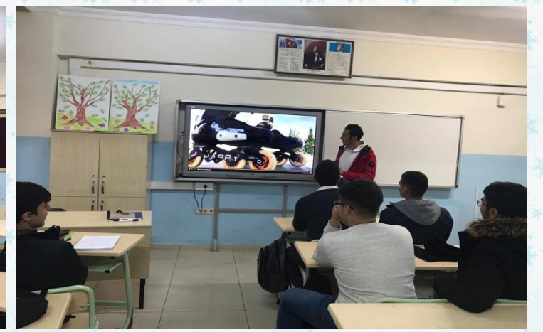
Öğrenciler sırayla akıllı tahtayı kullanarak hobilerini sunum ve videoyla anlatıyorlar.