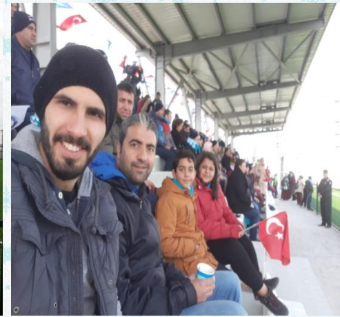
Sosyal okul Mehmet Akif İnan Ortaokulu Şahinbey Belediyesi Ampute takımı maçını öğrencilerimizle izleyip takımımıza destek olduk.