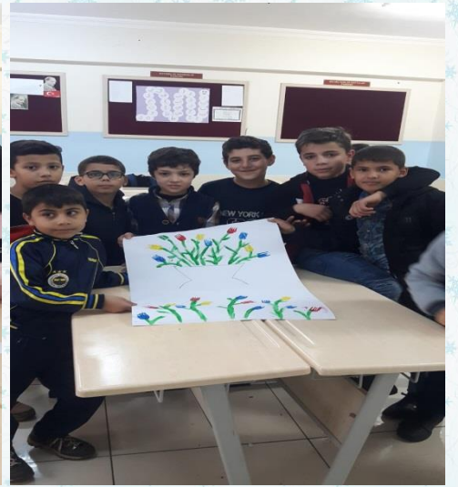
4.sınıf öğrencilerimiz resim çalışması yapıyor.