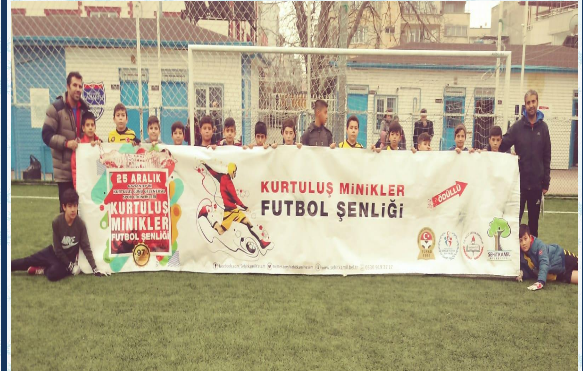
Mehmet Akif İnan Ortaokulu 25 Aralık Kurtuluş Kupasında Reaksiyon Futbol Okulunu 4-1 Yendi.