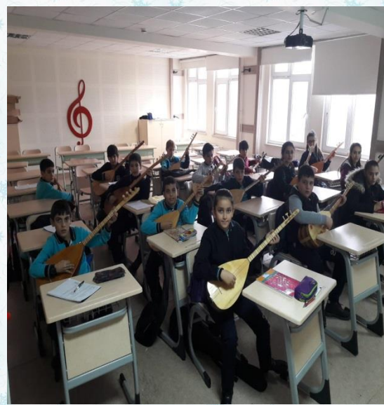
Bağlama ve Gitar kurslarımız tüm hızıyla sürüyor.