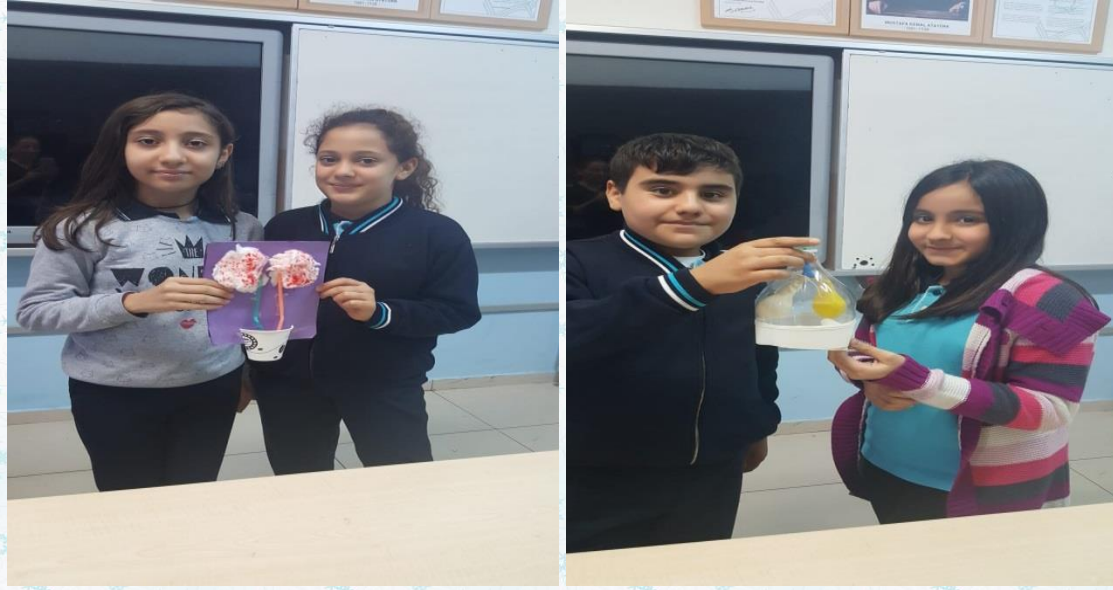
6.sınıflar Fen Bilimleri Sistemleri yapıyor.