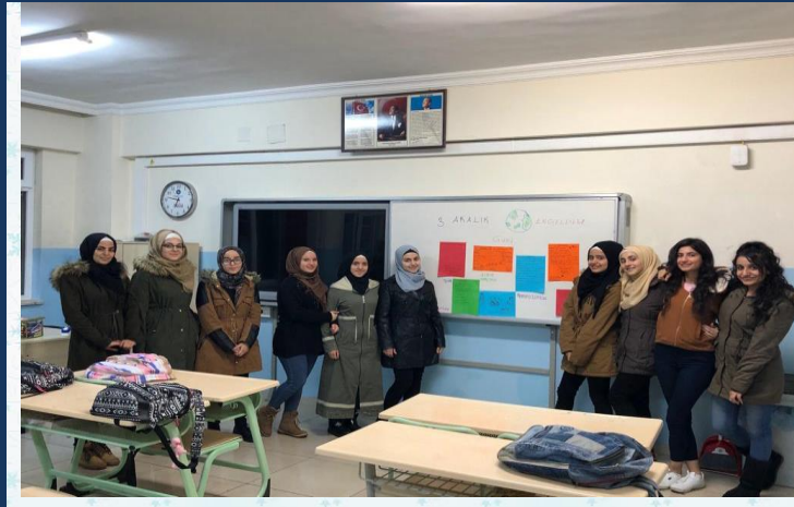
3 Aralık Dünya Engelliler Günü için farkındalık etkinliği grup çalışması yapıldı. Öğrencilere gruplara ayrıldı, verilen engelli sloganlarını kompozisyon, resim, şiir, zihin haritası ve sloganlar türeterek yazılı hale getirdi, sınıfta grupların çalışmalarını sergilendi.