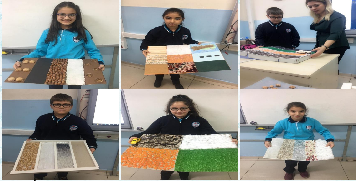
Öğrencilerimiz Fen Bilimleri dersinde sürtünme kuvvetini kendi yollarını oluşturarak öğrendiler