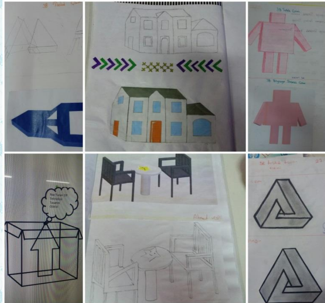
Öğrencilerimizin Taslak Çizimleri doğrultusunda hazırladıkları bilgisayar destekli tasarım taslakları.