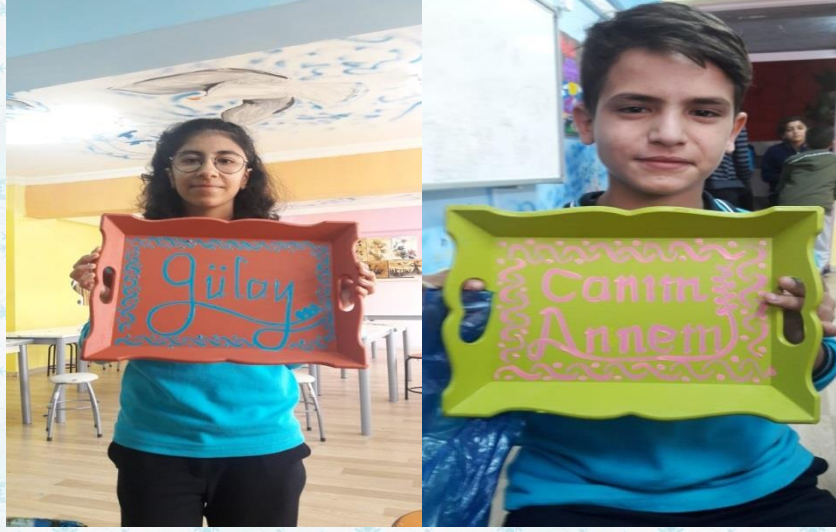
Görsel Sanatlar dersinde öğrencilerin isteği üzerine ahşap tepsi üzerine anneleri için baskı hazırladılar.