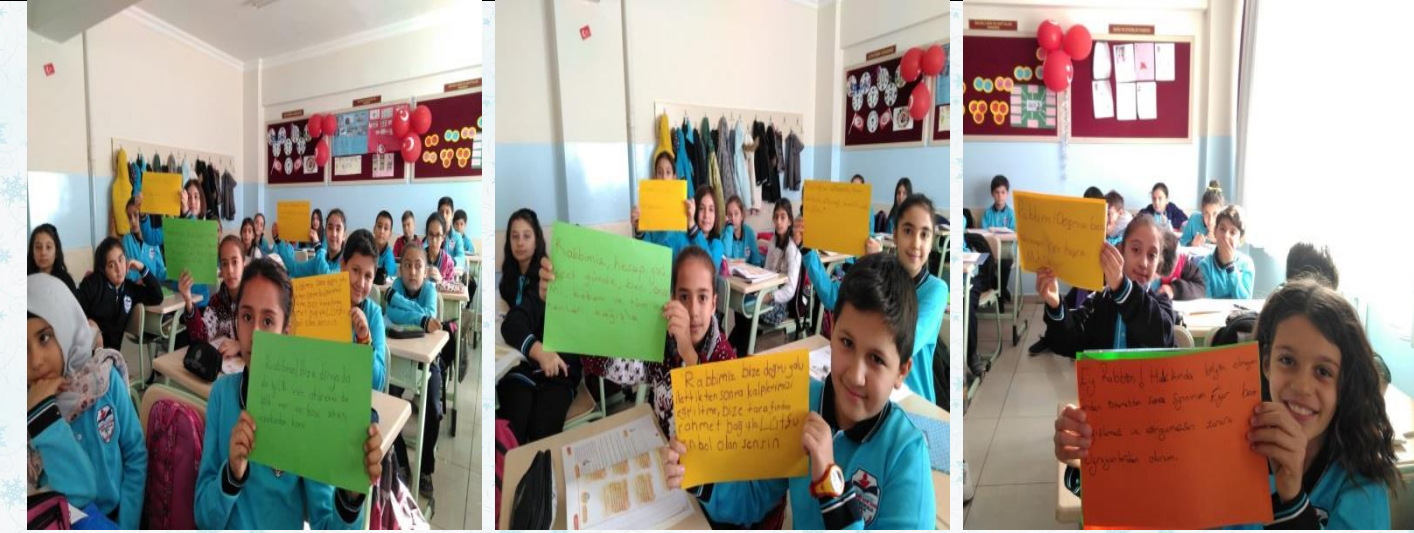
5. sınıflarla bu hafta dua KONUSUNU İŞLEDİK. 5/B sınıfından öğrencileri Kur'an'dan dua örneklerini araştırıp, öğrendiler. Yazdıkları duaları dersin sonunda sınıf panosuna da asıp, her gün sınıfa geldiklerinde hep birlikte bu duaları okuyarak güne başlayacaklar.