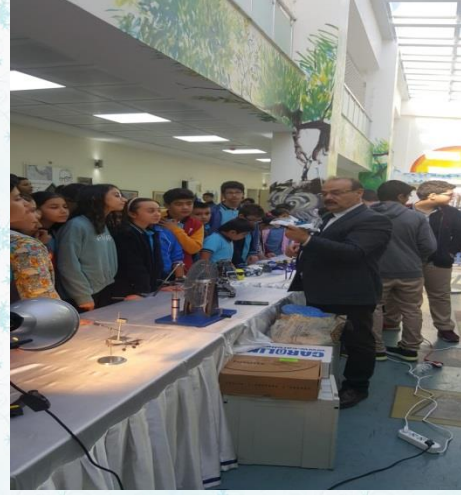
Bilim ve Sanatın dili BİLSEM'de etkinliklere katıldık.