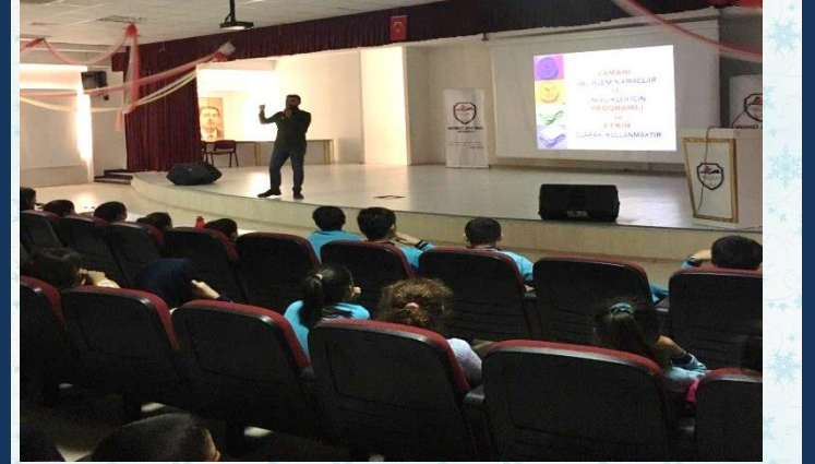
5.6.7.ve 8. Sınıflara VERİMLİ DERS ÇALIŞMA SEMİNERİ verildi.