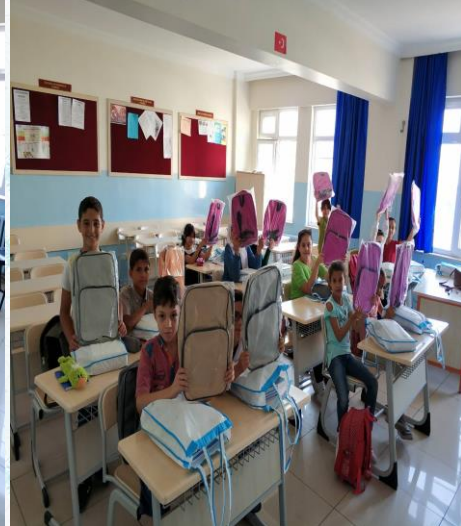
İl Milli Eğitim Müdürlüğümüz tarafından gönderilen kırtasiye malzemeler okulumuz öğrencilerine dağıtıldı.