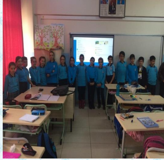
Tarih yazının icadıyla başlar. "Söz uçar, yazı kalır" kulaktan kulağa oyunu ile pekiştirildi.