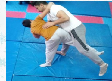
JUDO Hafta içi her gün 14.30-18.10