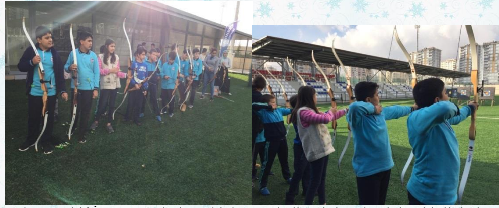
Mehmet Akif İnan Ortaokulu Şahinbey Belediyesinin Okçuluk etkinliğinde...