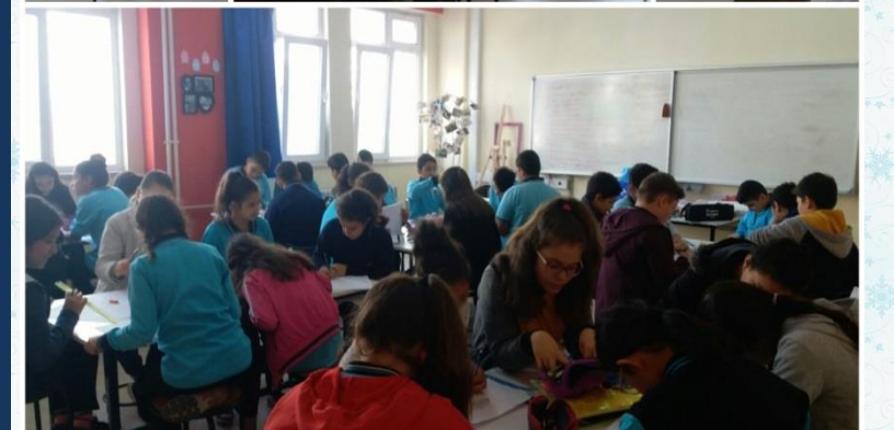
Tasarım sürecine atölyemizi tasarlamakla başladık.