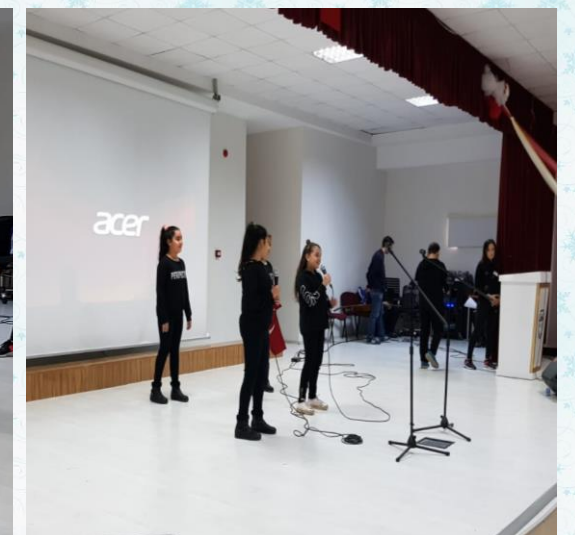
Ulu önder Mustafa Kemal Atatürk’ü saygı ve rahmetle anıyoruz...