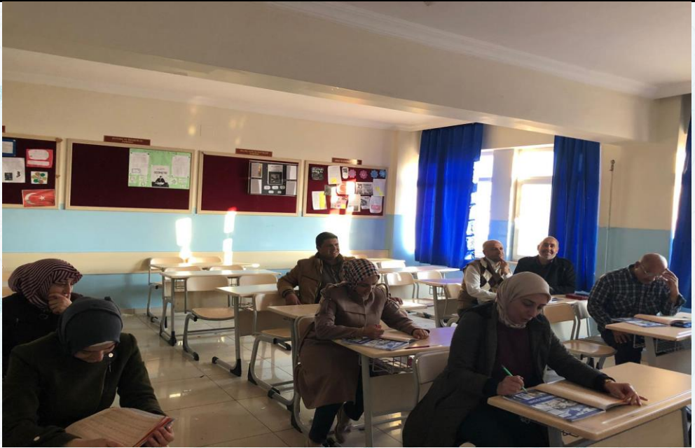
Okulumuzda Suriyeli gönüllü öğretmenlerimize A/2 seviyesinde Türkçe kursu verilmeye başlanmıştır.