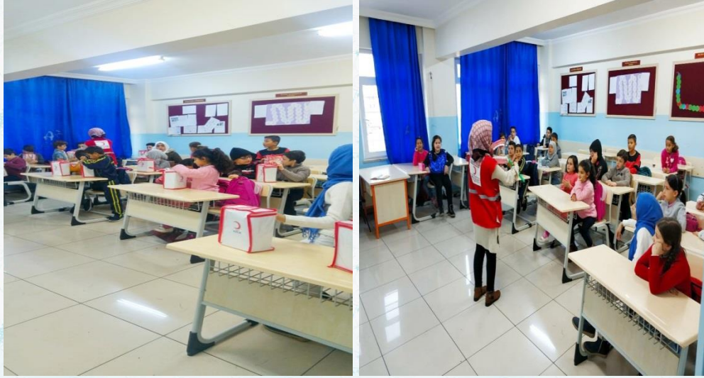
Türk Kızılay' ı görevlileri okulumuzdaki öğrencilere hijyen eğitimi vererek öğrencilerimize eğitim sonrası temizlik kitleri dağıttılar. Teşekkürler Türk Kızılay' ı....