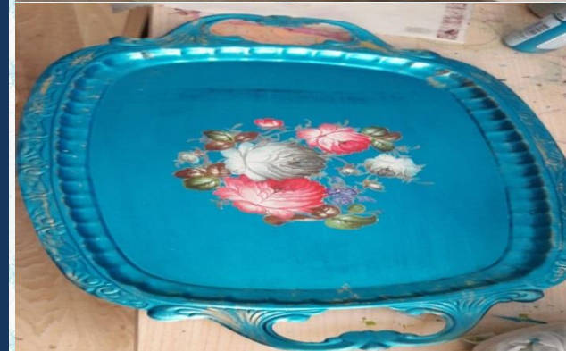
Eskiyen tepşirilerimize geri dönüşüm yapıyoruz.