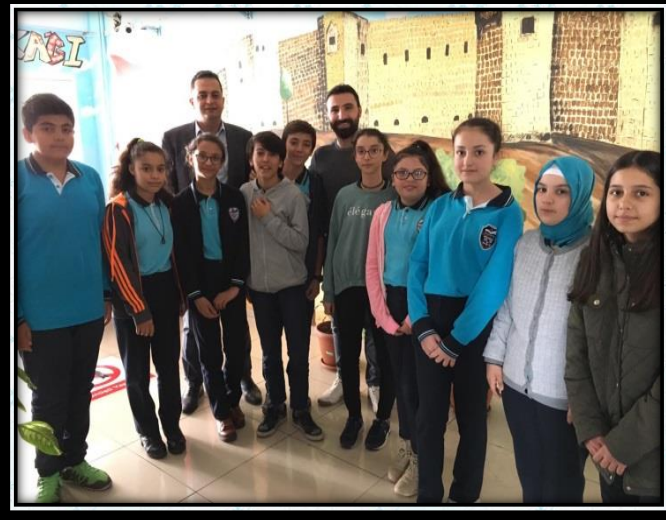
Okulumuzda sınavlarda başarılı olan öğrenciler.