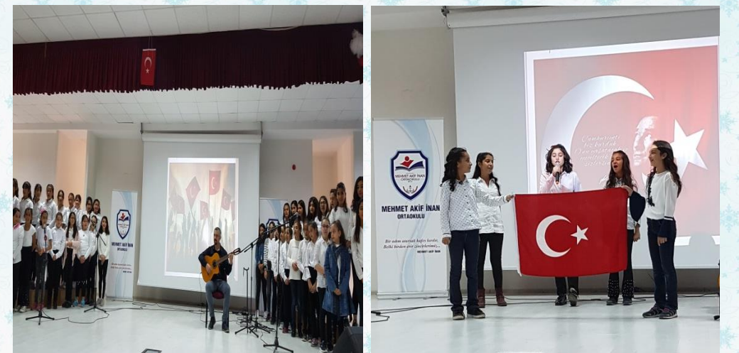
29 Ekim okulumuzda büyük bir coşkuyla kutlandı.