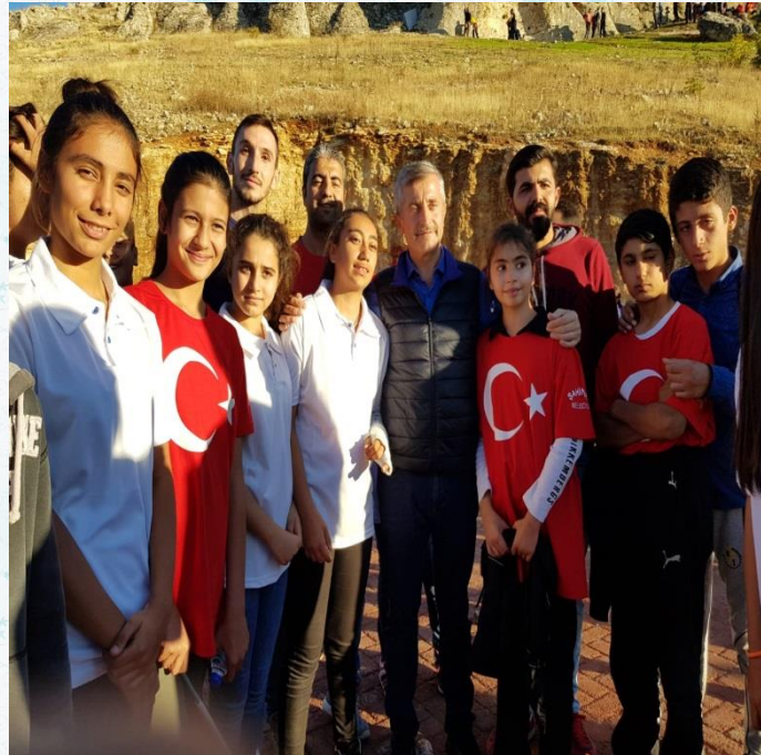
Sosyal okul Mehmet Akif İnan Ortaokulu Şahinbey Belediyesinin düzenlediği Doğa Yürüyüşü, Yamaç Paraşütü ve Dağcılık Etkinliğine 70 öğrenci, 10 veli ve 4 öğretmen ile katıldı.