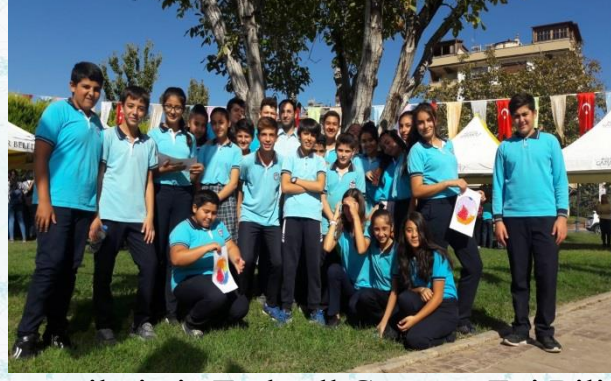
Öğrencilerimiz Turkcell Gezegen Evi Bilim Atölyelerine Katıldı.