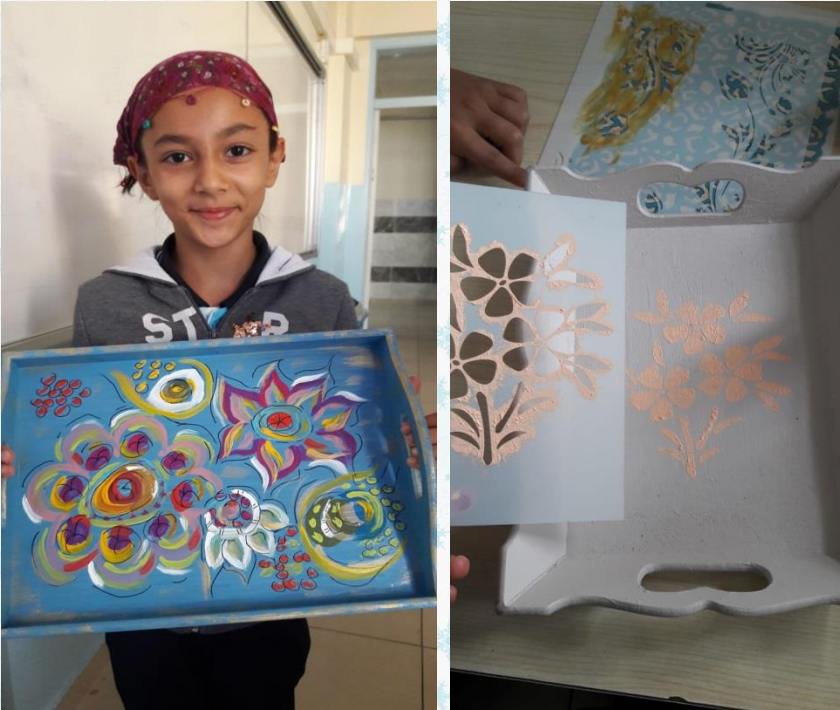
Görsel sanatlar dersinde ahşap üzerine çalışmalarımız devam ediyor.