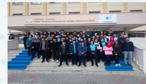
TÜRK TELEKOM MTAL