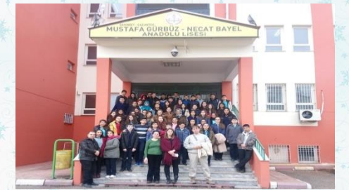
MUSTAFA GÜRBÜZ NECAT BAYEL ANADOLU LİSESİ