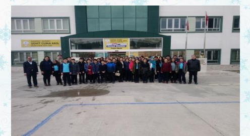
ŞEHİT CUMA AKIL ANADOLU İMAM HATİP LİSESİ