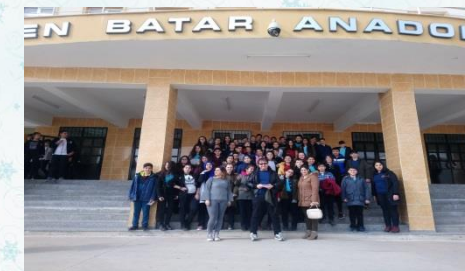
GÜLŞEN BATAR ANADOLU LİSESİ