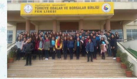
TOBB FEN LİSESİ

8. Sınıf öğrencilerimize yönelik yeni sınav sistemi doğrultusunda öğrencilerin lise tercihlerinde yardımcı olmak ve farkındalık yaratmak amacıyla Fen Liseleri, Sosyal Bilimler Lisesi, Anadolu İmam Hatip Lisesi, Anadolu Liseleri ve Mesleki ve Teknik Anadolu Liselerine gezilerimiz başarıyla tamamlanmıştır. Geziler sonrasında öğrencilerimizden gelen geri bildirimler neticesinde öğrencilerimizin okul türleri hakkında ve yapacakları tercih konusunda daha somut bilgilere sahip oldukları gözlemlenmiştir.