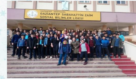
SABAHATTİN ZAIM SOSYAL BİLİMLER LİSESİ