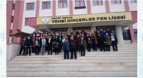
VEHBI DİNÇERLER FEN LİSESİ